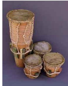
Tamburi sacri Ekuè

Tra i suoi migliori principi morali si trovano la necessità dei suoi membri di essere buon padre, buon figlio, buon fratello e buon amico. Abakuá è una società di mutuo soccorso. Si potrebbe considerare una sorta di massoneria afro-cubana. Una delle prime società Abakuá fu costituita nel 1836, quando gli appartenenti al Cabildo Carabalí Apapá , fondarono la prima potencia nel villaggio di Regla con il nome di Efik-Butón . Esistono anche società Abakuá formate solo da bianchi.